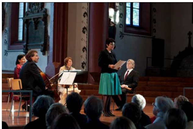
Die Ansprache von Anita Fetz, Ständerätin Basel-Stadt

Ständerätin Anita Fetz brachte dem Publikum in ihrer Begrüssungsansprache die Krankheit Noma näher: „Noma, diese furchtbare Kinderkrankheit ins Bewusstsein unserer Öffentlichkeit zu rufen, ist eine der wichtigen Aufgaben von NOMA-HILFE-SCHWEIZ. Darum findet auch dieses Benefizkonzert hier in Basel statt“.