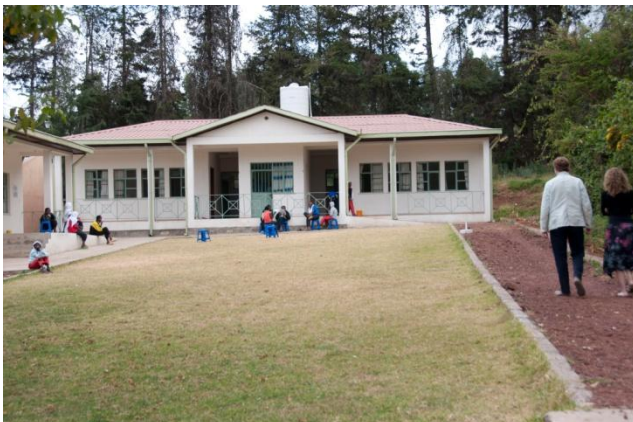
Cheshire Home von Facing Africa ,ausserhalb von Addis Abeba

worden (Noma Children Hospital Sokoto). PHE will eine epidemiologische Studie vornehmen, um die Relevanz von Noma in einem gegebenen nahrungsarmen Umfeld zu berechnen. Cleft-Patienten liefern dabei die zu Grunde liegenden Daten.