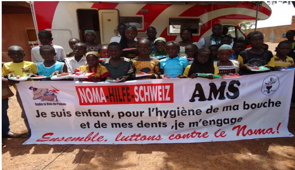
Photo N° 10: des cadeaux pour les meilleurs élèves aux différents jeux concours

Il est donc souhaitable de poursuivre dans cette direction afin de toucher encore d'autres écoles et d'autres enfants.