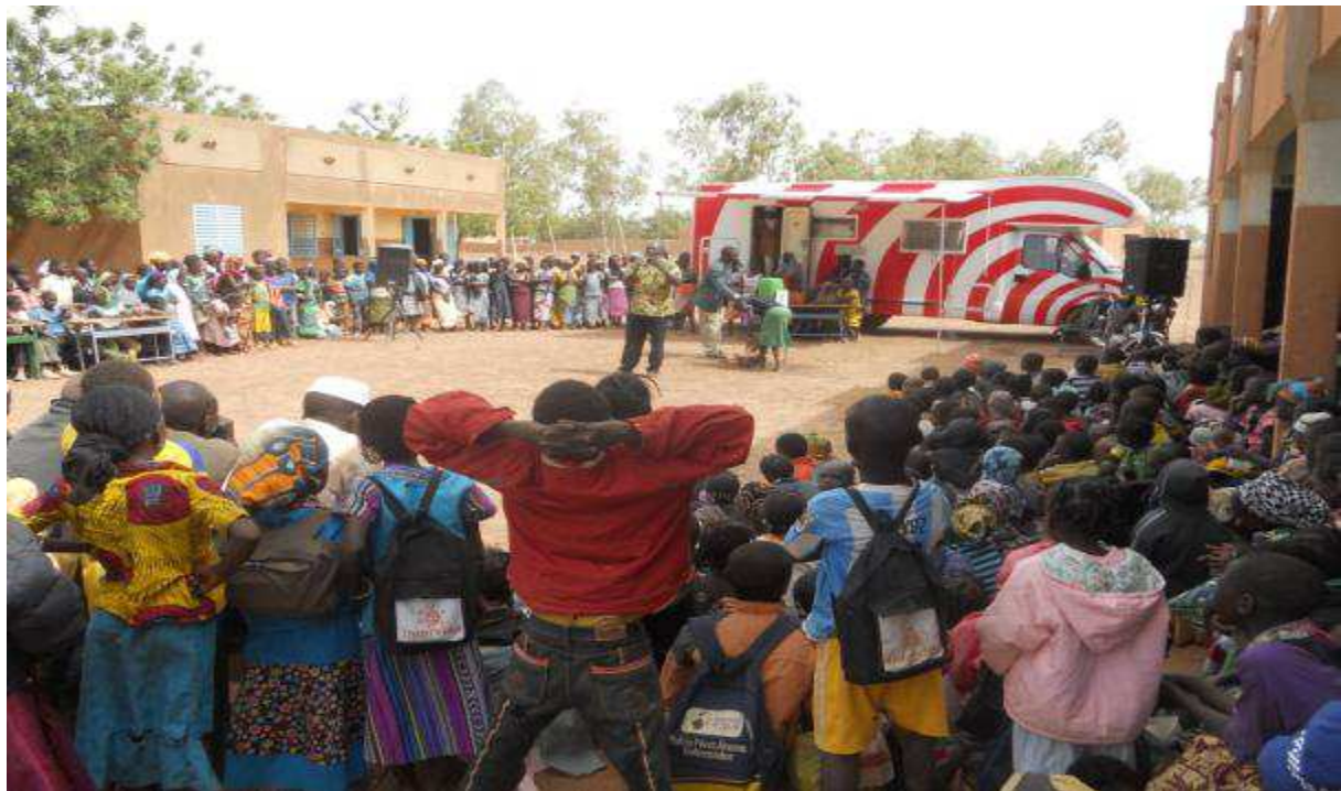
Le zèbre en action